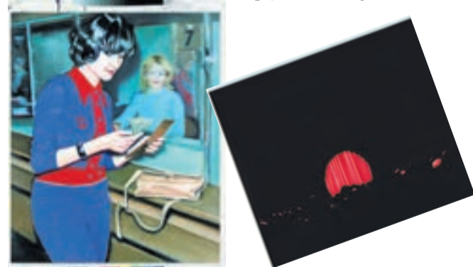
Dodatek przygotowany na zlecenie Górnośląskiego Związku Metropolitalnego