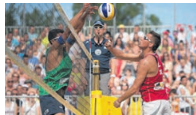
► Oczy fanów siatkówki plażowej zwrócone są znów w stronę Mysłowic

Sportowo i organizacyjnie ubiegłoroczne mistrzostwa zostały wysoko ocenione przez Światową Federację Siatkówki, dlatego zdecydowano się powierzyć śląskiemu miastu kolejną imprezę tej rangi. ●